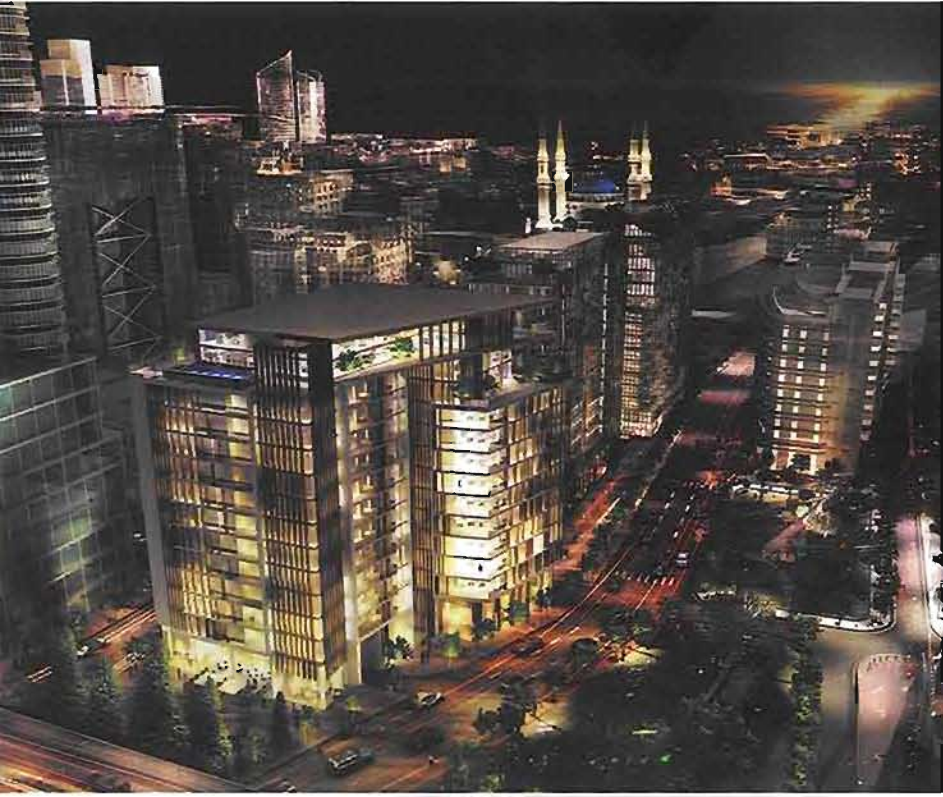
باب بيروت... قلب بيروت

شبكة "سوليدير" لساحة الشهداء نجد أنهم يحاولون أن يعيدوا العاصمة الى ما كانت عليه في السابق حين كانت تعجّ بالمحلات التجارية والمسارح والفنادق إضافة الى المباني السكنية. وأرى أن ساحة الشهداء بعد ٣ سنوات ستكون مختلفة تماماً عما هي اليوم.